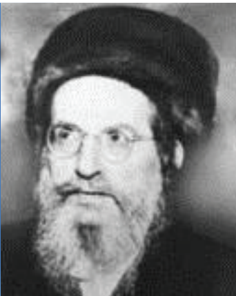
רבינו בעל הסולם נשמת האריז"ל בדורינו