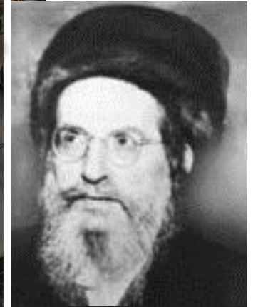
רבינו בעל הסולם נשמת האריז"ל בדורינו